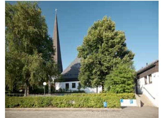
Gemeindezentrum in Stephanskirchen-Haidholzen mit Heilig-Geist Kirche, Gemeindehaus und Pfarrhaus

Geodaten: N: 47° 51.776' O: 012° 10.461'